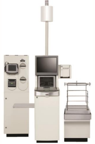
Toshiba Kasiyersiz Kasa